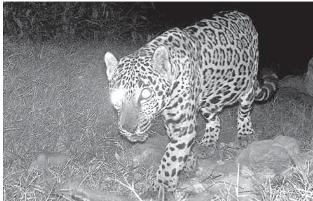
"Sahuaripa y sus alrededores son el último refugio norteño de las hembras de jaguar como la que aparece en esta fotografía del pasado diciembre y que fue bautizada "Cholla" por los biólogos de Naturalia"

hay mucha riqueza de vida, que los biólogos llaman "biodiversidad" y en donde éstos han desaparecido la biodiversidad desaparece detrás de ellos. Por eso para proteger un ecosistema complejo y rico como el de Sahuaripa, se vuelve importante proteger a sus jaguares y por eso también la Reserva ha tomado al jaguar como su emblema.