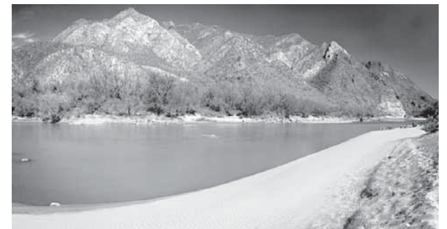
"La Reserva del jaguar del Norte protege también varios kilómetros del río Aros, que después forma el río Yaqui"

Con el establecimiento de la Reserva del Jaguar del Norte, Naturalia ha asegurado que los jaguares estén protegidos al menos dentro de sus límites. En esta reserva no se crían ni se introducen nuevos animales, tan sólo se protege y estudia a los que de manera natural ahí habitan, como lo pueden constatar los vecinos ganaderos que la conocen y visitan. Pero esa protección no es suficiente, todos en Sahuaripa tenemos que ayudar a que el jaguar y la biodiversidad que existe gracias a él no desaparezcan. En otra edición platicaremos más de cómo proteger al jaguar sin arriesgar al ganado y hablaremos de los mitos que sobre la especie existen y los datos que los biólogos de Naturalia han descubierto en Sahuaripa. Por lo pronto debemos considerar un orgullo tener la reserva más norteña del mundo dedicada a la protección de estos felinos y recapacitar sobre la responsabilidad que tenemos como guardianes de nuestra parte del planeta.